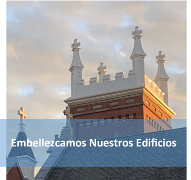
Embellizamos Nuestros Edificios

Párroco, Santa María de la Inmaculada Concepción