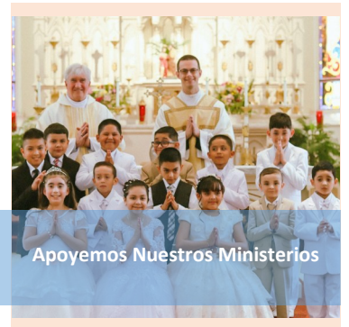
Apoyemos Nuestros Ministerios