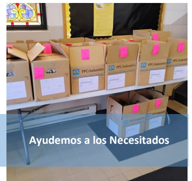
Ayudemos a los Necesitados